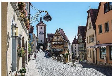
Rothenburg ob der Tauber